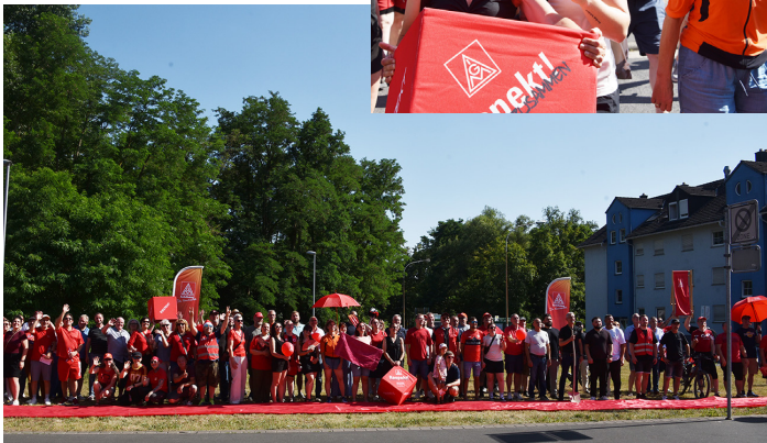
Ein Ritual nach den Betriebsratswahlen ist der Betriebsräteempfang vor dem Gewerkschaftshaus. Die Chance wurde genutzt für einen Flashmob gegen den Sozialbau