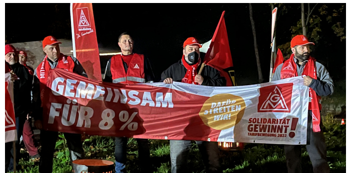
Gemeinsam für 8%