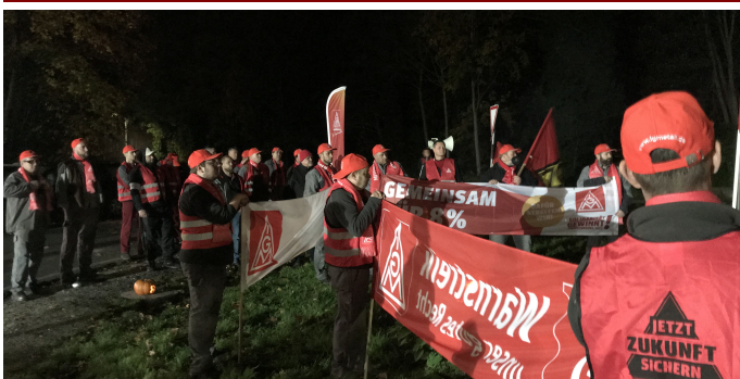
Kurz nach Mitternacht - Weilbach steht!

Du willst immer den aktuellen Stand der Verhandlungen kennen? Du willst auch die Kolleg:innen in anderen Betrieben unterstützen und wissen, wann sie Warnstreiken? Du willst mehr Bilder von den Aktionen sehen?