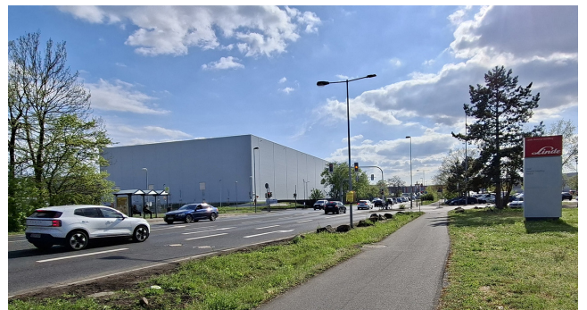
URBAN Hochregallager an der Großostheimer Straße

Ist eine 100-prozentige Tochter der KION-Group AG, einem der weltweit größten Anbieter für Intralogistiklösungen. Gegründet wurde Urban 1965 in München als Logistikunternehmen der Linde Technische Gase.