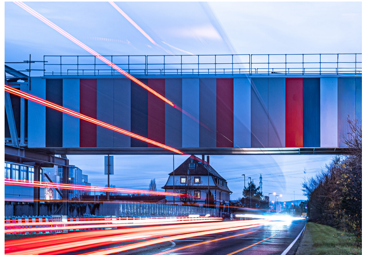
Die markante Logistikbrücke über der Großostheimer Straße ist die Verbindung vom Urban-Logistiklager zu den Montagen von Linde Material Handling.

Die Wahl fand am 22.04.2026 statt. Es kandidierten insgesamt vierzehn Kandidatinnen und Kandidaten aus drei Standorten, davon vier Frauen, für die sieben Betriebsratssitze. Die Wahlbeteiligung mit 80 Prozent war hervorragend. Gewählt wurden sieben