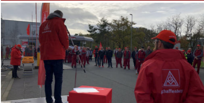
Angebot? Was für ein Angebot?