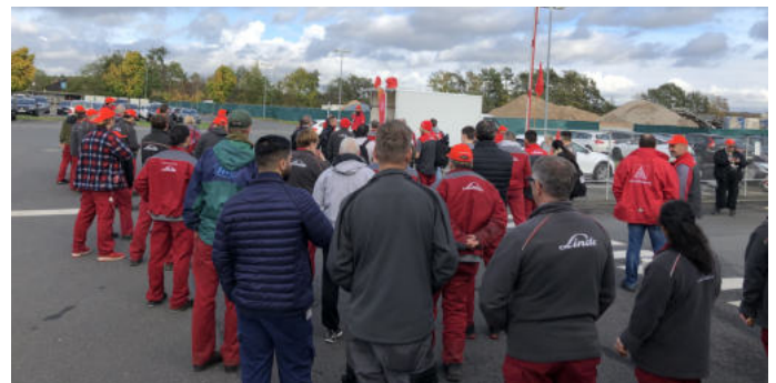
Linde Werk III in Kahl steht still!