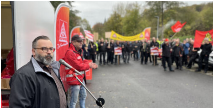
Jetzt ist Schluss mit lustig