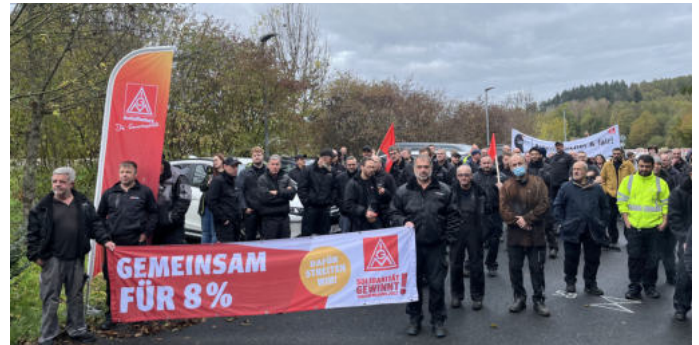
Gemeinsam für 8% - auch in Keilberg