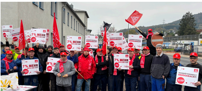
Düker in Laufach