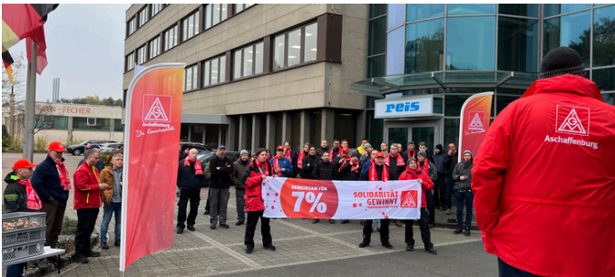
Reis Robotics in Obernburg

Heute zwei kleinere Aktionen - aber mit mindestens genauso viel Biss und Kampfgeist! Reis Robotics und Düker stehen stabil - für 7 % und 170 € mehr für die Azubis!