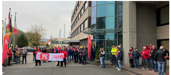
7 % und 170 € mehr Azubivergütung!