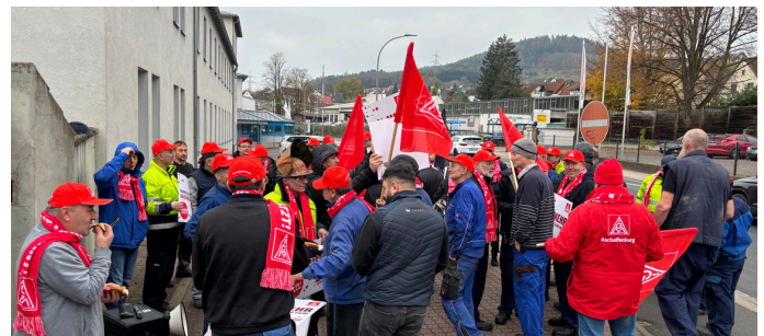
Die Produktion steht!